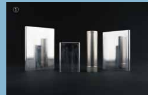
① Battery Cases for Mobile phones and PCs