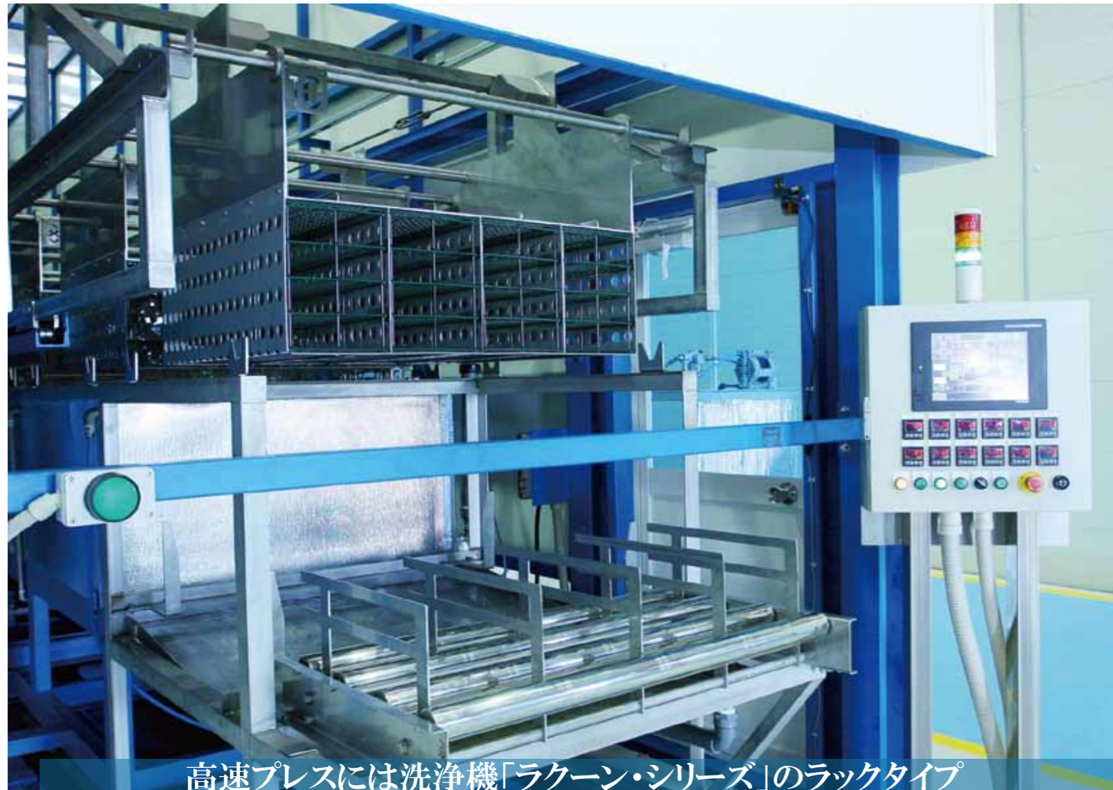
高速プレスには洗浄機「ラクーン・シリーズ」のラックタイプ

RACK MODEL RACCOON SERIES -The Rack Type Washing Machine for high speed pressing-