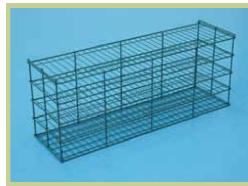
Protective Washing Cartridge

株式会社NIMURAは、洗浄でお困りのお客様の、あらゆるニーズに合わせた洗浄機を製作しています。洗浄工程でおこる打コンやキズなどのダメージから、製品を保護してしっかり戦場、特にプレス機に適した洗浄機として定評をいただいております。また社内での一貫生産体制を構築することで実現した、ご満足いただける価格と短納期でお客様にご対応させていただいております。