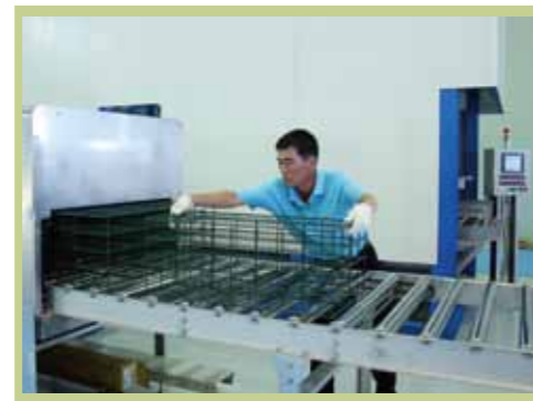
Only 1 operator is needed