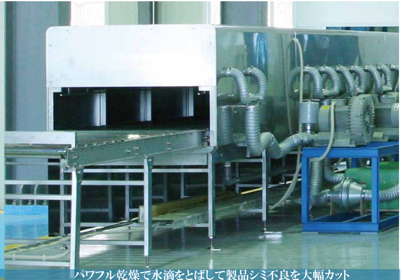
パワフル乾燥で水滴をとばして製品シミ不良を大幅カット

RACK MODEL RACCOON SERIES -The Rack Type Washing Machine for high speed pressing-